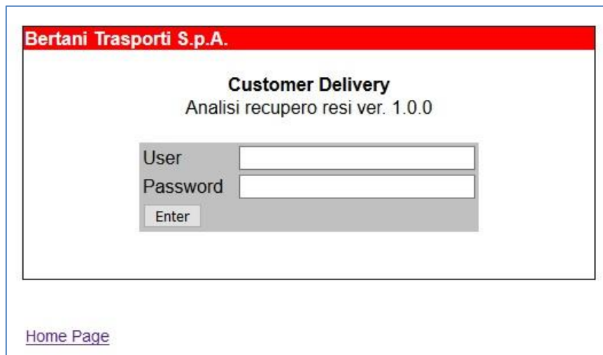
Fig. 1 pannello di accesso all'applicazione

http://212.210.191.144:8080/WebPortalResi/WebPortalResi_Pass.html