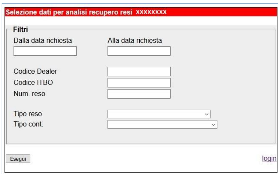
Fig. 2 pannello delle selezioni

Dopo l'accesso ottenuto con utente e password (attenzione i due termini sono case sensitive) si presenta il pannello con le scelte possibili