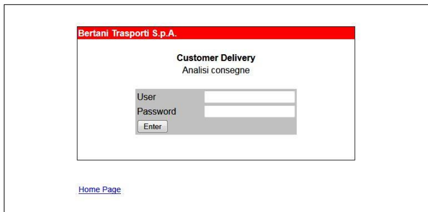
Fig. 1 pannello di accesso all'applicazione

http://212.210.191.144:8080/WebPortal/WebPortalRicambi_Pass.html