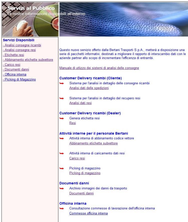
Fig. 6 pagina dei servizi al pubblico

I link alle applicazioni compaiono sia sul menu di sinistra, sia al centro della pagina